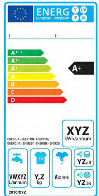
Abbildung 2: Blanko-Label für Waschmaschinen

Das wesentliche Element der Label ist die Energieeffizienzklasse des Produkts. Grundsätzlich gibt es sieben Energieeffizienzklassen : von A (sehr effizient) bis G (wenig effizient), die zudem mit einer Farbskala von dunkelgrün bis tiefrot unterlegt sind. Bei entsprechendem technischen Fortschritt konnten außerdem (bislang) die Klassen A+, A++, A+++ angefügt werden. Zusätzliche Piktogramme auf dem Label geben Auskunft über den jährlichen Energieverbrauch und weitere produktspezifische Informationen (bei Waschmaschinen z. B. den Wasserverbrauch oder die Schleuderwirkung).