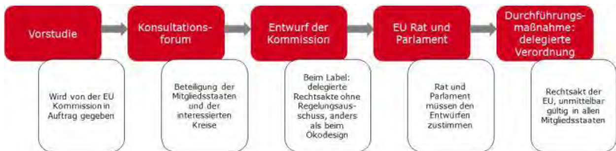
Abbildung 3: Entscheidungsprozess für delegierte Verordnungen im Rahmen der Energieverbrauchskennzeichnung (Quelle: Bundesanstalt für Materialforschung und -prüfung).

Der Entscheidungsprozess über einen delegierten Rechtsakt läuft ebenfalls ähnlich dem Prozess des Ökodesigns ab. Es gibt jedoch keinen Regelungsausschuss .